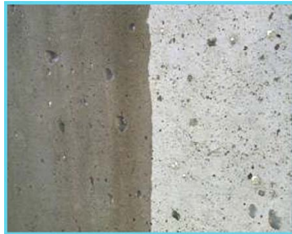
6 år gammel betongmur